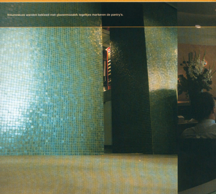
Volumineuze wanden bekleed met glazenmozaïek tegeltjes markeren de pantry's.