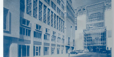
Olympus bevindt zich op de eerste verdieping boven de Turfmarkt. De nieuwe dependance biedt 900m 2 extra kantoorruimte

Bezoekadres: Kalvermarkt 53 • Postadres: Postbus 16229 • 2500 BE Den Haag Algemeen telefoonnummer: 070-3567400 • Algemeen faxnummer: 070-3567515