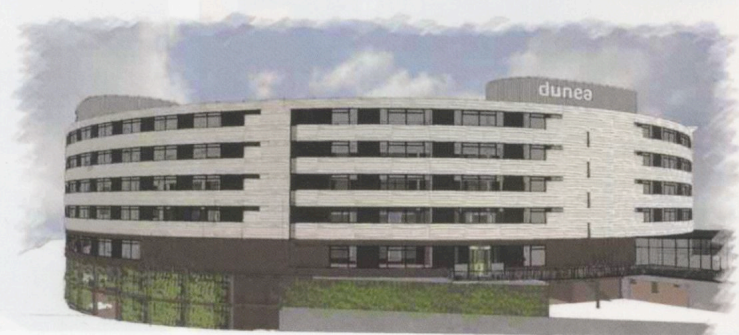
Facade wordt ingrijpend getransformeerd